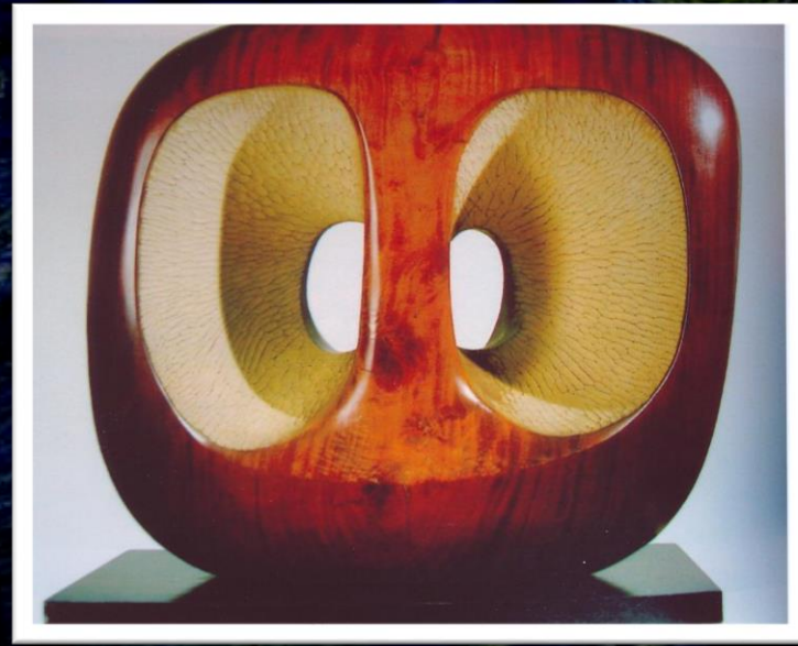
รูปทรงกลวงด้วยการตกแต่ง ผลงานของบาร์บารา เฮปเวิร์ท ( BARBARA HEPWORTH )